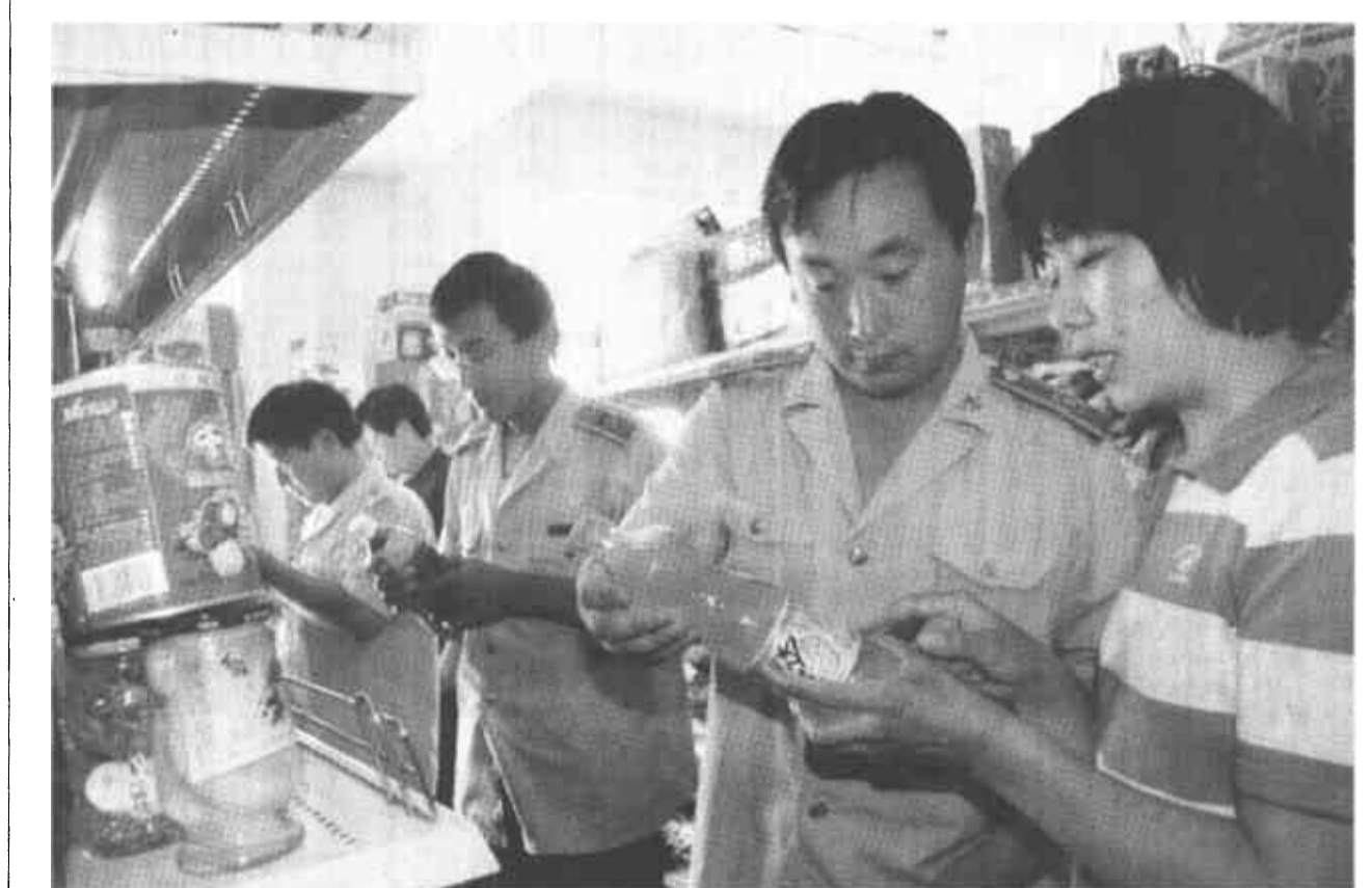
入夏以来，利津县城关工商所加大对副食、饮料市场的监督检查力度。共检查副食、饮料商店56家，查处过期饮料260箱，有效地净化了市场。